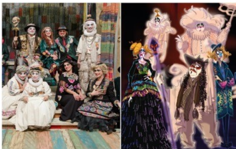
Figura 1. Os fantasmas e a trupe – Personagens do espetáculo e ilustração da HQ

Além da figura dos personagens concebidos pelo autor, conforme o mesmo anuncia com detalhes nas didascálias, os personagens apresentados nos quadrinhos são uma composição que considera seus intérpretes na encenação do Grupo Galpão, e suas características, tais como porte físico, trejeitos e expressões engendradas para as cenas, bem como cabelo, maquiagem e figurinos. Na imagem a seguir, pode-se perceber a nítida proximidade visual entre a estética dos atores em cena e a transposição dos mesmos para as ilustrações que compõem a HQ.