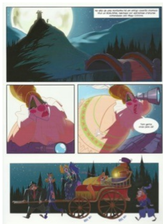
Figura 3. A trupe da Condessa chega ao vilarejo