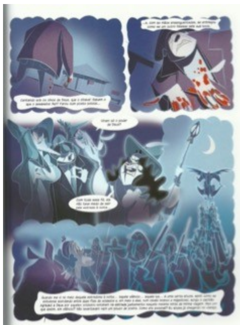
Figura 6. Cotrone narra um fato assustador

Sendo o sonho a matéria-prima de Pirandello, muitos são os momentos em que a história migra para a imaginação dos personagens ou flashbacks , quando os quadros ganham tons azulados, reforçando seu aspecto fantástico. As curvas sinuosas indicam os acontecimentos que não estão no plano da realidade e remetem também a fantasias e devaneios dos personagens.