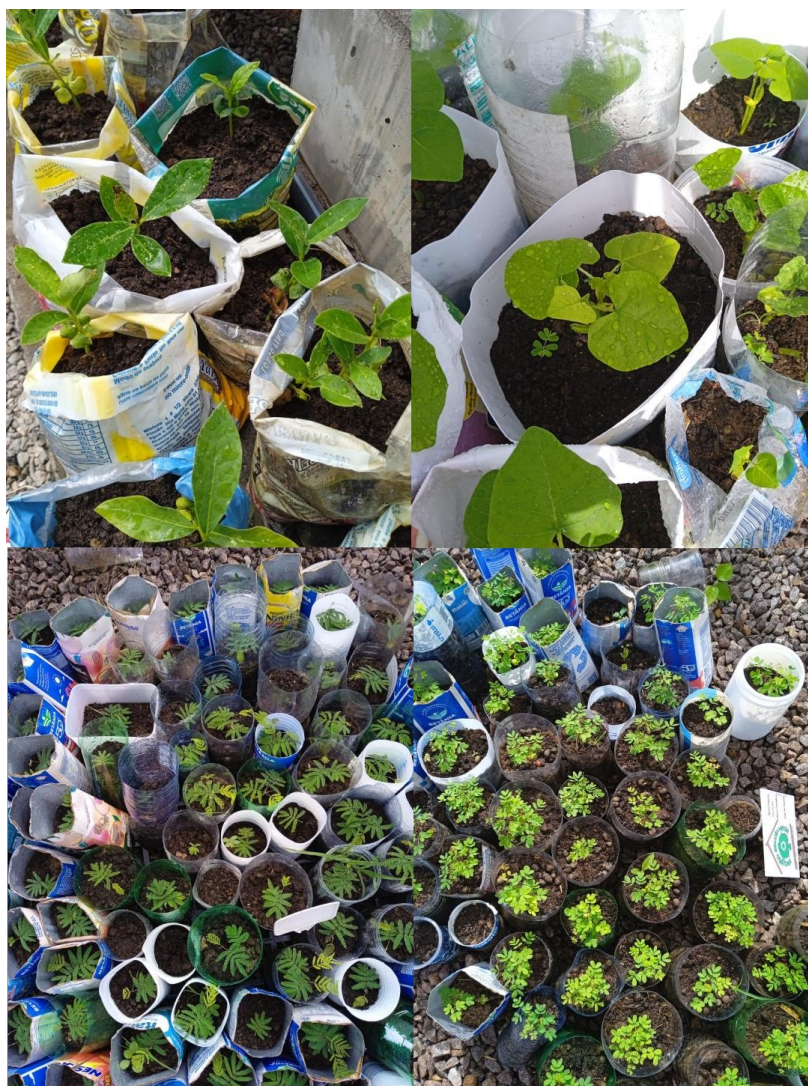
Figura 5. Mudanças de espécies nativas da Caatinga produzidas nos recipientes recebidos através de doação no projeto

(baraúna); Senna spectabilis (canafistula); e Tabebuia aurea (ipê-amarelo). A etapa de produção em viveiro mostrando as mudas de algumas dessas espécies pode ser vista na Figura 5.