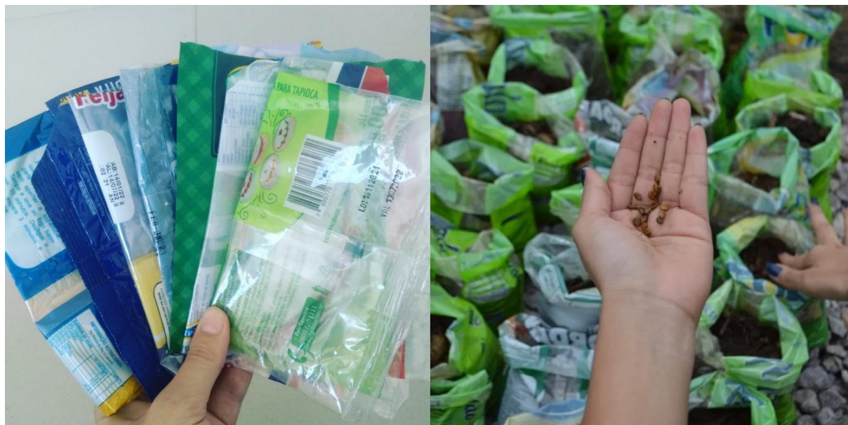
Figura 2. Sacos plásticos de alimentos não-perecíveis recebidos no coletor instalado no Restaurante Universitário (RU) do CCA/UNIVASF e processo de semeadura utilizando esses materiais