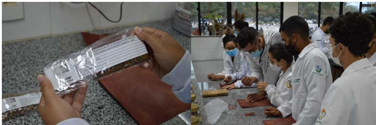
Figura 4. Capacitação sobre manejo de sementes para os integrantes do Projeto Reutilize UNIVASF promovida pela equipe do POVASF/LASMASF/UNIVASF

Através do projeto, os colaboradores envolvidos foram capacitados de maneira prática e teórica sobre o manejo de resíduos sólidos, coleta seletiva, educação ambiental, manejo de sementes e gerência de viveiros de produção de mudas, assim cumprindo de maneira satisfatória os objetivos propostos no plano de trabalho da iniciativa. Um exemplo de capacitação sobre manejo de sementes pode ser visto na Figura 4, retratando um curso de capacitação sobre manejo de sementes oferecido aos participantes pelos integrantes do Laboratório de Sementes e Manejo de Flora (LASMAF) da UNIVASF.