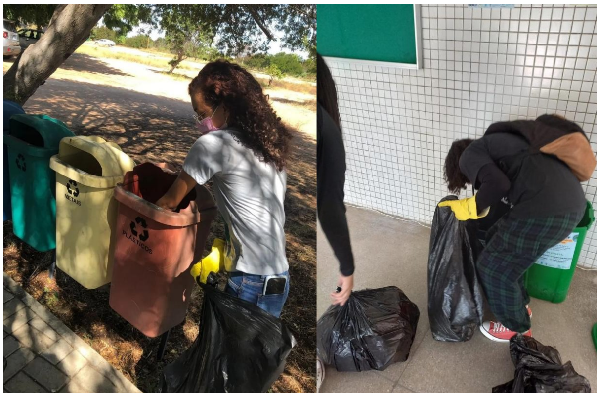
Figura 6. Busca ativa por recipientes plásticos no Projeto Reutilize UNIVASF