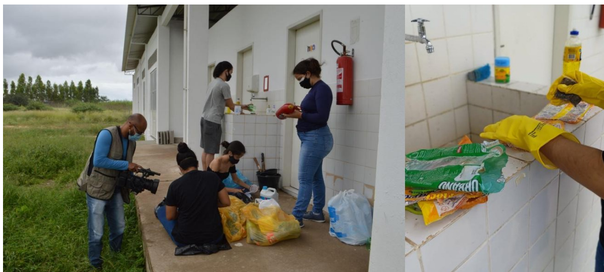
Figura 3. Processamento dos materiais recebidos no Projeto Reutilize UNIVASF