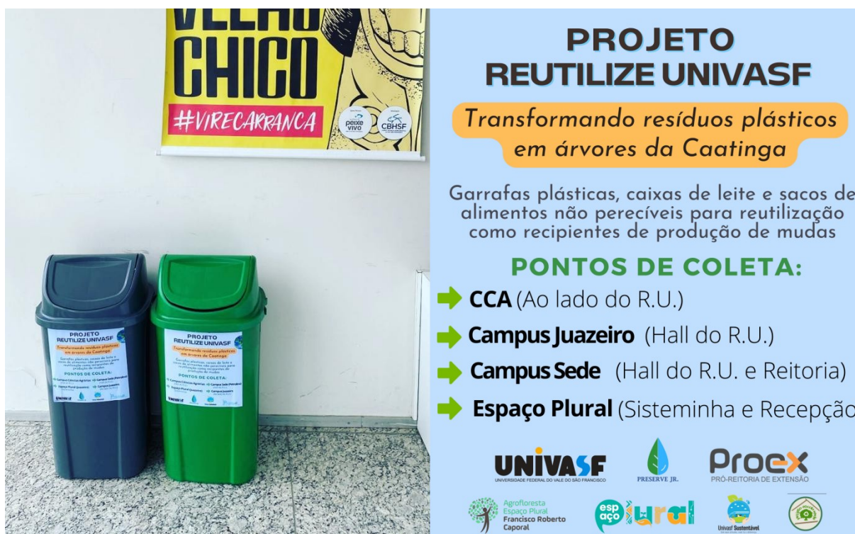
Figura 1. Coletores e arte de divulgação do Projeto Reutilize UNIVASF, elencando os órgãos parceiros e os pontos de coleta de recipientes descartados. O ponto de coleta visto à esquerda refere-se à Reitoria da UNIVASF.

caixas longa vida e sacos de alimentos) a serem descartados pela comunidade. Esses coletores foram inicialmente distribuídos em seis pontos de coleta nos quatro campi da UNIVASF nas cidades de Juazeiro - BA e Petrolina - PE, sempre em locais com grande visibilidade e trânsito de pessoas, conforme visto na Figura 1. Os coletores estavam acessíveis tanto à comunidade acadêmica quanto ao público externo. Após cerca de seis meses de início do projeto, mais coletores foram recebidos e instalados em outros quatro locais do Campus Ciências Agrárias.