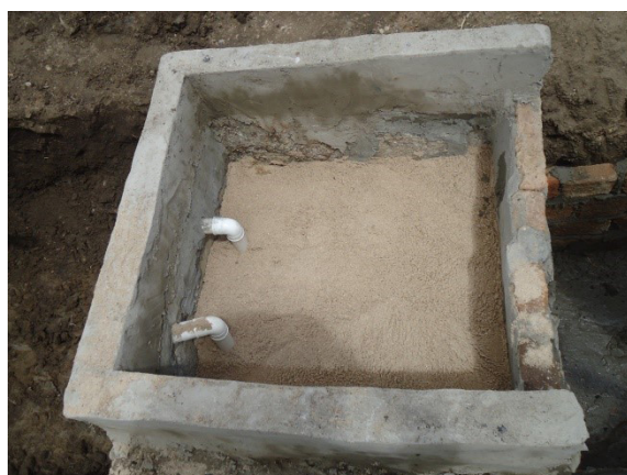
Figura 3: Modelo de tanque com as camadas para filtragem da água introduzida.

Na propriedade, para construção de 1 (uma) caixa de gordura, mais 3 (três) tanques para filtro biológico (a exemplo da Figura 3), em alvenaria e conjugados, medindo 85 cm x 1m de profundidade, gasta-se em torno de R$ 350,00 (trezentos e cinquenta reais), conforme especificações a seguir (Tabela 4).