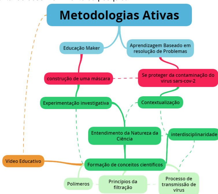
Figura 3: Mapa mental do desenvolvimento da pesquisa.

Desse modo, nossos resultados evidenciam que as PME objetivam construir um protótipo pensado como solução para um problema social, por meio do trabalho colaborativo, possibilitando PFI o desenvolvimento de diversas estratégias didáticas, como a contextualização, a experimentação investigativa, o entendimento da natureza da Ciência e visando um ensino de química mais crítico. Objetivou-se, assim, formar conceitos científicos, utilizando um vídeo educativo como uma ferramenta da ação mediada, conforme mapa mental apresentado na figura 3.