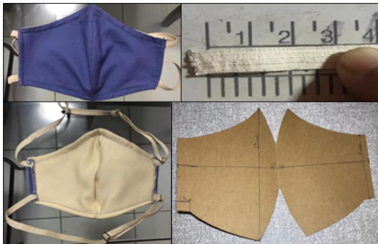
Figura 1: Protótipo construído pelos professores em formação inicial, sendo a parte azul o algodão e a branca, o Neoprene.