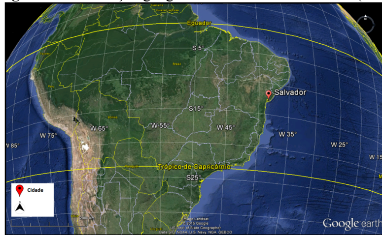
Figura 1. Localização geográfica da cidade de Salvador (BA).

seus 56 km de praias, os quais oferecem uma grande potencialidade para a prática de esportes náuticos visando atender aos interesses desses setores da economia.